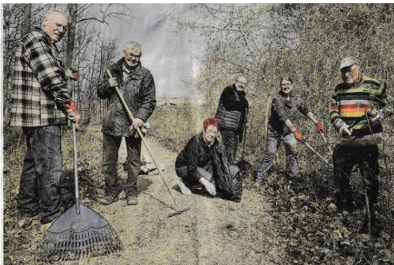
Seit Jahren kümmern sich die Mitglieder des Merseburger Altstadtvereins darum, die historische Hohe Brücke und umliegende Wege in Ordnung zu halten. So auch beim diesjährigen Frühjahrsputz wieder.